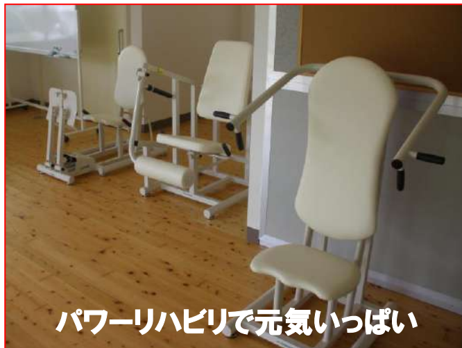
パワーリハビリで元気いっぱい