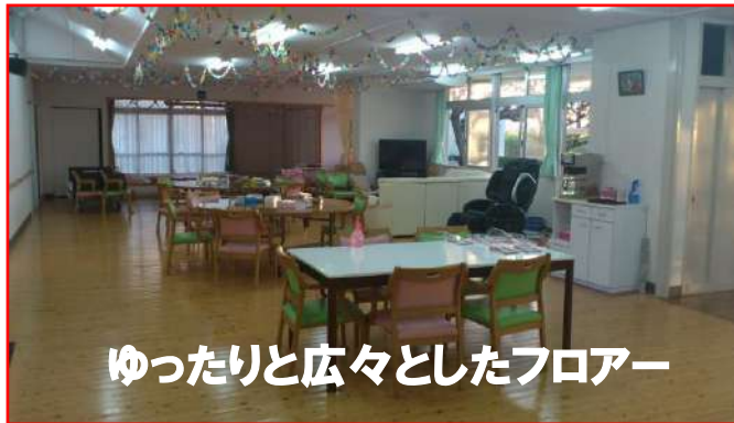
ゆったりと広々としたフロアー